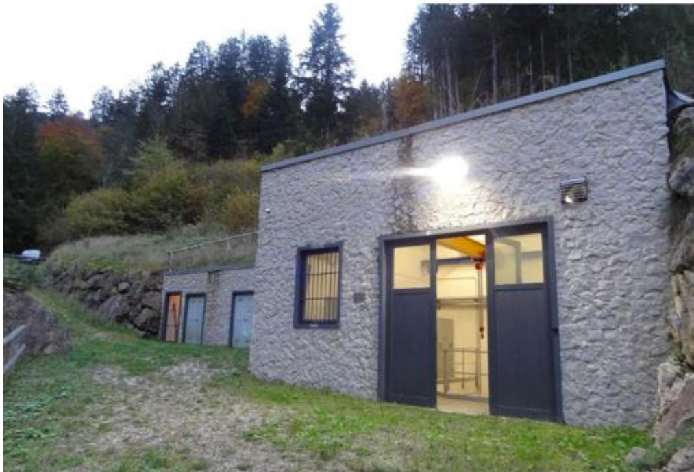
Powerhouse des Kraftwerkes Rite Basso

Das Kraftwerk verfügt über eine Einspeisevergütung in Höhe von 0,155 €/kWh bis Mai 2035.