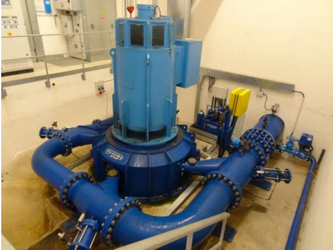
Pelton-Turbine des Kraftwerkes Rite Basso