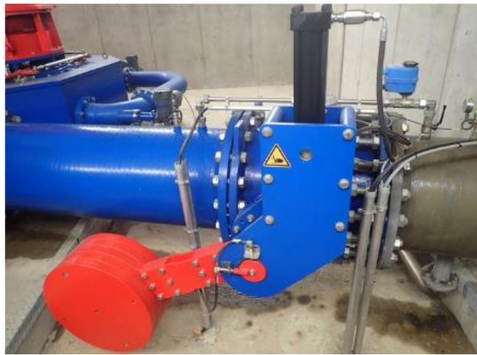
Pelton Turbine des Wasserkraftwerkes Korpitsch