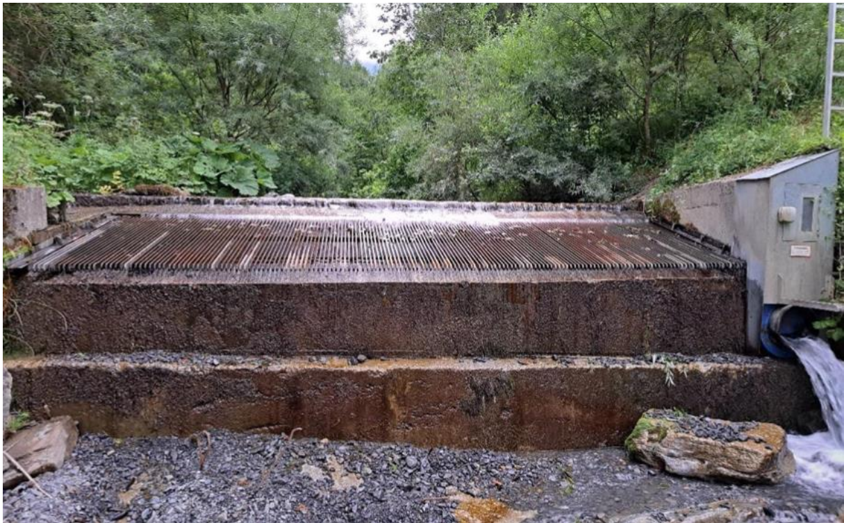
Tiroler Wehr bei der Wasserentnahme