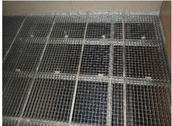
Eingangsbereich zum Entsandungsbecken